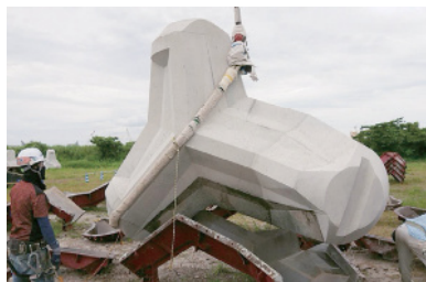
シーロックアドバンス61(12t)