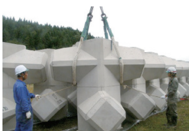
コーケンブロック(10t)